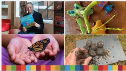
Arrangementer for børn i Uge 17