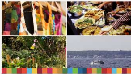
Arrangementer i Uge 17